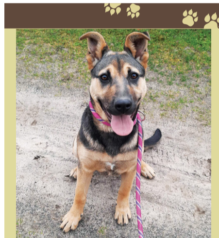
Suczka rasy mieszanej, wiek około półtora roku, umaszczenie czarne-podpalane.